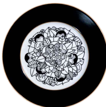
Ref. C3 75 €