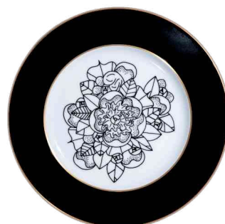
Ref. C7 66 €