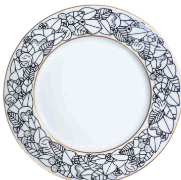
Ref. K1 (motif unique) 75 €