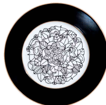
Ref. C4 75 €