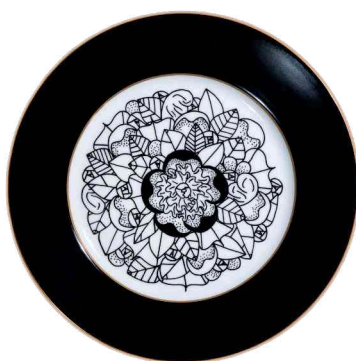
Ref. C2 75 €