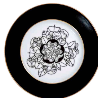
Ref. C8 66 €