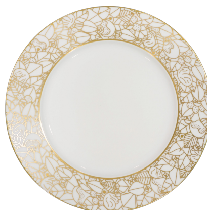
Ref. K2 (or intégral) 150 €

Vente en ligne : www.pmdag.com ou par mail : pmdag.art@gmail.com en indiquant les références et quantités souhaitées