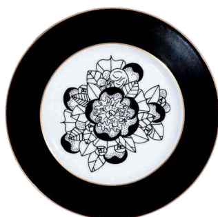
Ref. C6 66 €