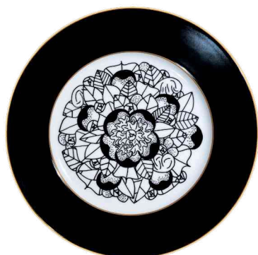
Ref. C1 75 €